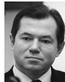
Сергей Юрьевич Глазьев (р. 01.01.1961) развил теоретические труды Кондратьева и Львова, в том числе в направлении прикладного использования

*- теорию Н.Д.Кондратьева развивали и дополняли Йозеф Шумпетер, Альфред Клайнкнехт, Саймон Кузнец, Герхард Мэнш, Томас Кучинский, Кристофер Фримен, в наибольшей степени Карлота Перес и др. Функционирует Международный фонд имени Н.Д. Кондратьева