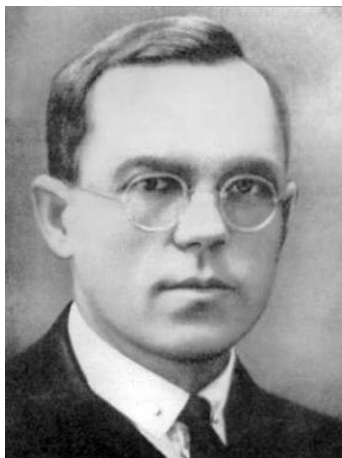
Николай Дмитриевич Кондратьев (04.03.1892 - 17.09.1938) сформулировал гипотезу о длинных волнах экономической конъюнктуры

Основы последующего ТУ закладываются в период расцвета предыдущего или даже предшествующего предыдущему. Пока предыдущий уклад не исчерпает всех возможностей своего развития, последующий уклад широкого развития не получает. В период становления нового ТУ доминирующие технические открытия определяют основные факторы производства, формируют передовые отрасли, влияют на смежные рынки, мировую экономику, геополитику (вплоть до мировых войн) и социальную сферу.